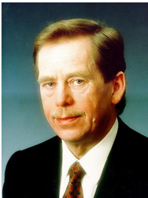
Václav Havel *5. 10. 1936 +18. 12. 2011

Zastupitelstvo obce na svém zasedání dne 20. prosince 2011 uctilo památku zesnulého prezidenta republiky Václava Havla minutou ticha a stažením státní vlajky před obecním úřadem na půl žerdi.