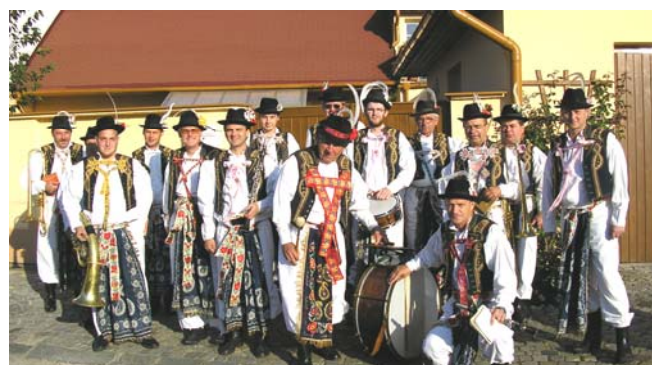
Slovácké slavnosti vína a otevřených památek, Uh. Hradiště 2008

světový rekord. Průvod trval bezmála tři hodiny a propojil Masarykovo náměstí s Vinohradskou ulicí. Jestliže první z krojovaných již prošli náměstím, ti poslední stále ještě procházeli mezi mařatickými vinnými sklepy. Průvodu jsme se zúčastnili společně s Kelnickým folklórním kroužkem Fěrtůšek, čímž jsme mohli poukázat na tradice mikroregionu Luhačovského Zálesí.